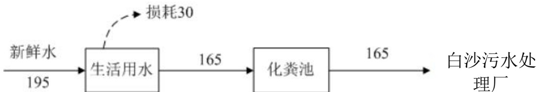
图 2.2-1 项目水平衡图（t/a）